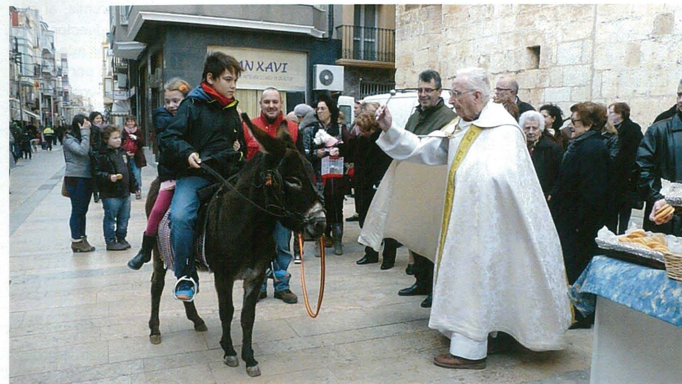
Celebració de la Festa de Sant Antoni